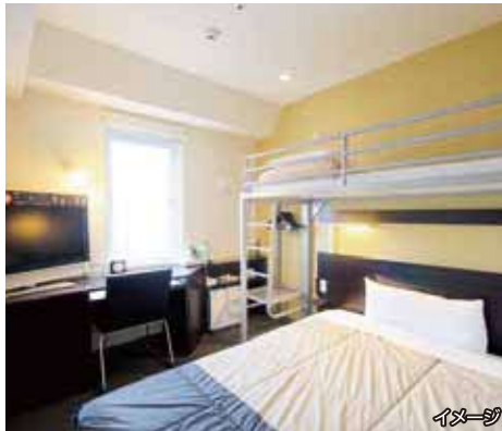
●ワイドベッド【幅140cm】+ロフトベッド