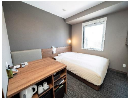
公式サイト予約で環境保全に繋がる「ECO泊」

「Natural, Organic, Smart」をコンセプトに、地球にも人にも優しいホテルの運営を手掛ける株式会社スーパーホテル（代表取締役社長：山本 健策、本社：大阪府大阪市）では、2010年3月から全店舗で実施しているカーボン・オフセット付き環境配慮型宿泊サービス「ECO泊」の累計宿泊数が 2,000万泊 を突破しました。スーパーホテルはカーボン・オフセットの仕組みを利用した脱炭素活動のリーディンググループとして13年目に重要な節目を迎えました。