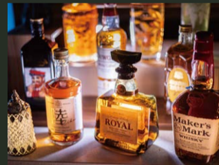
無料のウェルカムバー