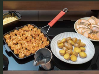
北海道ご当地メニュー