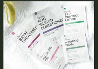
オーガニックアメニティ