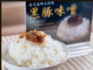
鹿児島ご当地メニュー