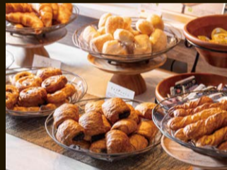
館内で焼き上げる焼きたてパン